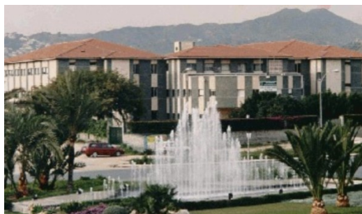
Junto al parque empresarial Santa Bárbara